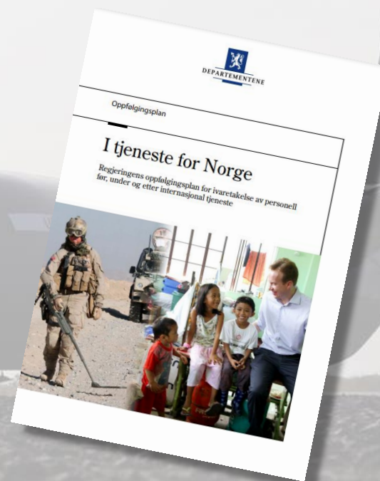
I tjeneste for Norge – Oppfølgingsplan (2014)