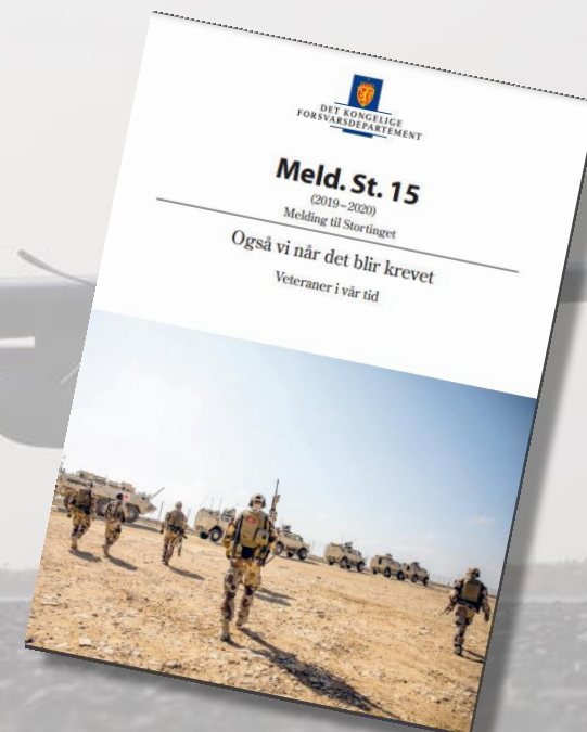
St.meld. nr. 15 (2019–2020)