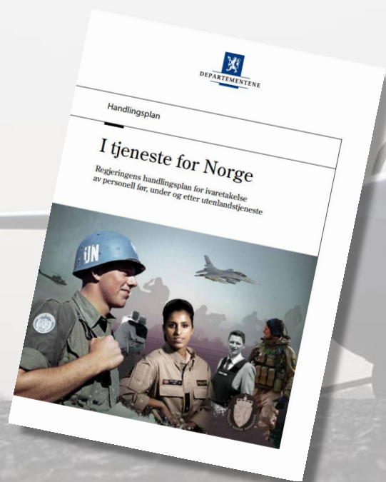
I tjeneste for Norge – Handlingsplan (2011 - 2013)