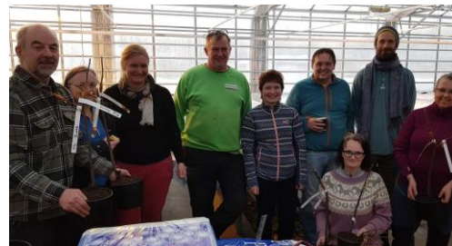
RURITAGE & FOSEN FRUKT STUDIETUR I FINLAND 20-24 juni 2022

Studietur til Finland i juni Samling på Inderøy hos Inderøy mosteri, september