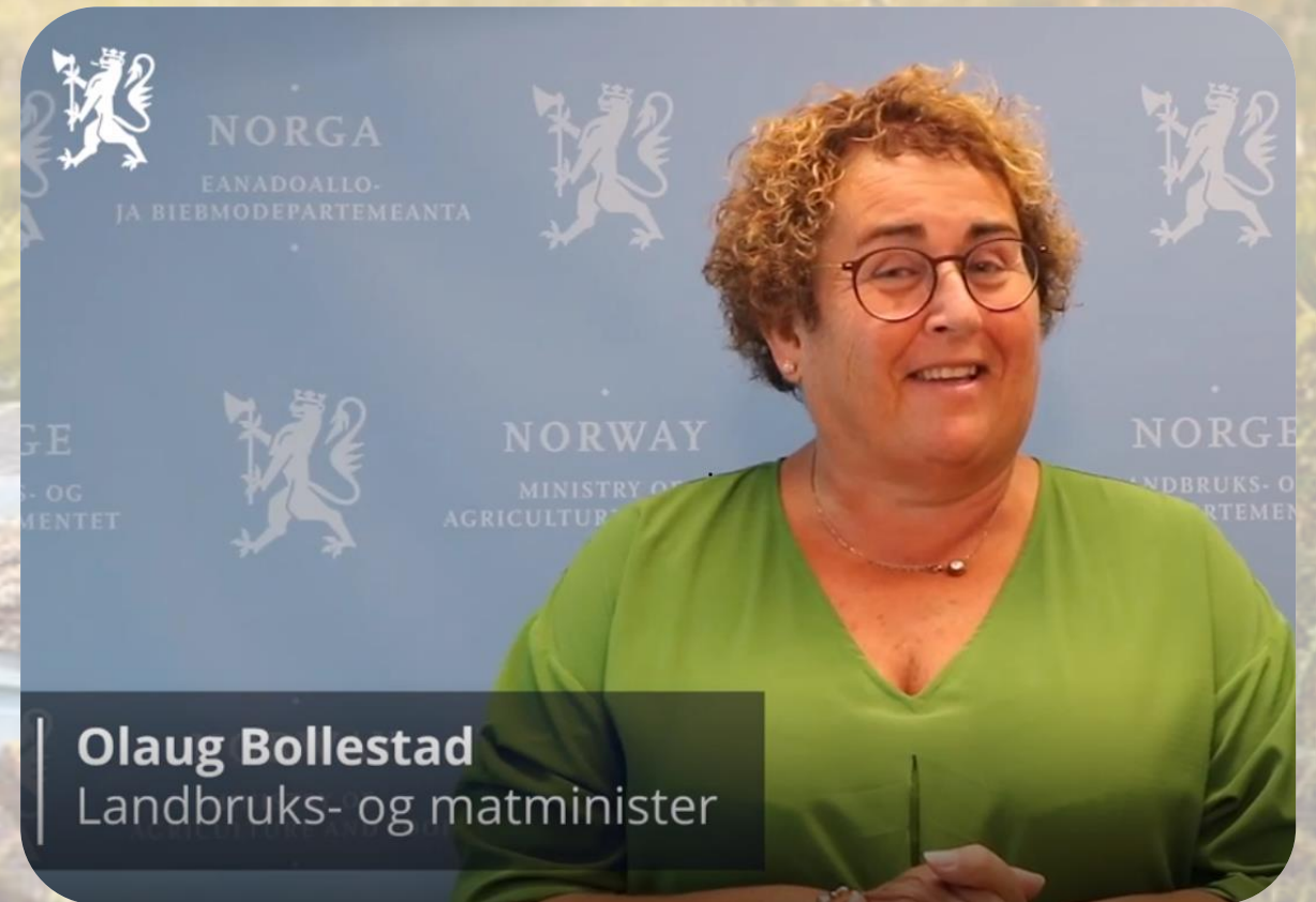
Olaug Bollestad Landbruks- og matminister