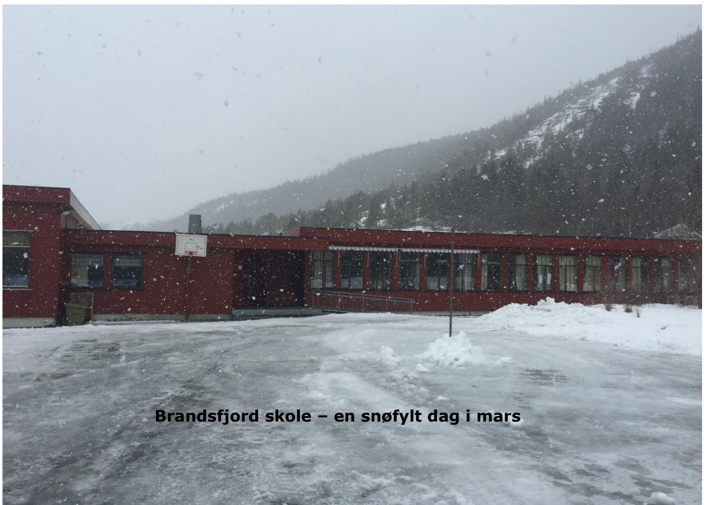
Brandsfjord skole – en snøfylt dag i mars

Rapport fra ekstern vurdering ved Brandsfjord skole i uke 12/2018