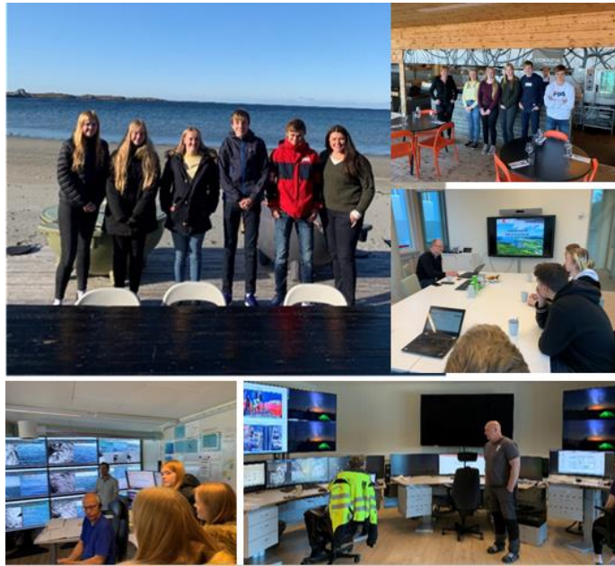
Elver fra Åfjord VGS på bedriftsbesøk hos Stokkøya Sjøsentor, Salmar, Refsnes laks og Åfjord sparebank. I tillegg besøkte vi Fosen fjordhotell.

Det er viktig å rekruttere tilstrekkelig og ønsket arbeidskraft i årene framover, derfor ønsket man en oversikt over behovet i næringsliv og bedrifter i Fosenregionen.