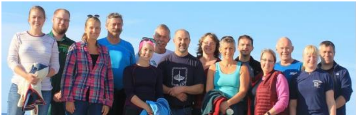
Landbrukskontoransatte er sentrale i arbeidet for DYRK Fosen. Det samarbeides aktivt med øvrige rådgivingsapparat, faglag og lokale myndigheter.

Organisatorisk ble det gjort vedtak om at prosjektet i større grad skulle ha administrativ styring. Derfor ble ny styringsgruppe etablert høsten 2019. Stor takk til avgått styre for engasjement og aktiv støtte i oppstart og igangsetting av arbeidet.